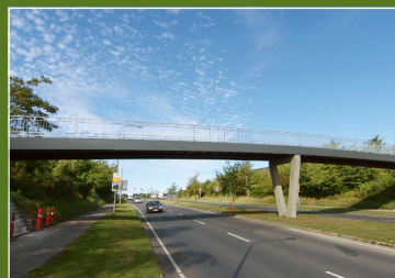
GFK Fiberglas Brücken