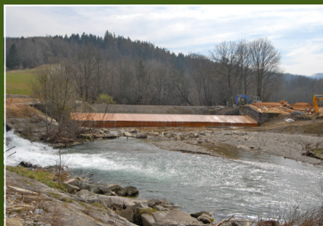
Wehranlagen und Werkskanal Sanierungen